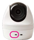
CC-2 / 2L